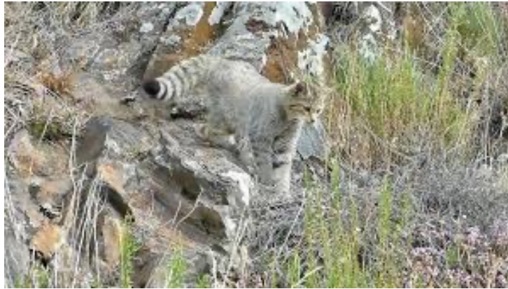
Chat forestier forêt

Demander : « Pourquoi à votre avis est-ce qu'il y a un accent circonflexe sur le mot forêt et il n'y en a pas sur le mot forestier ? »